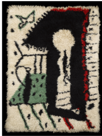
Pablo Picasso, Serrure, vers 1965 © Succession Picasso 2016