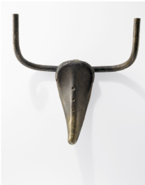
Pablo Picasso, Tête de taureau, 1942 © Succession Picasso 2016